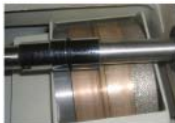
Cuatro muelas: Devaste, Biselado, Pulido