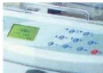
Menú digital - Pantalla LCD que facilita su uso y manipulación